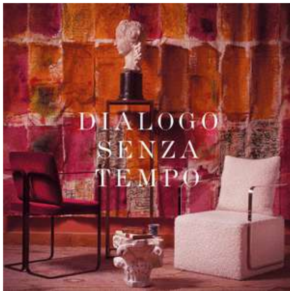
( https://www.longariartemilano.com )