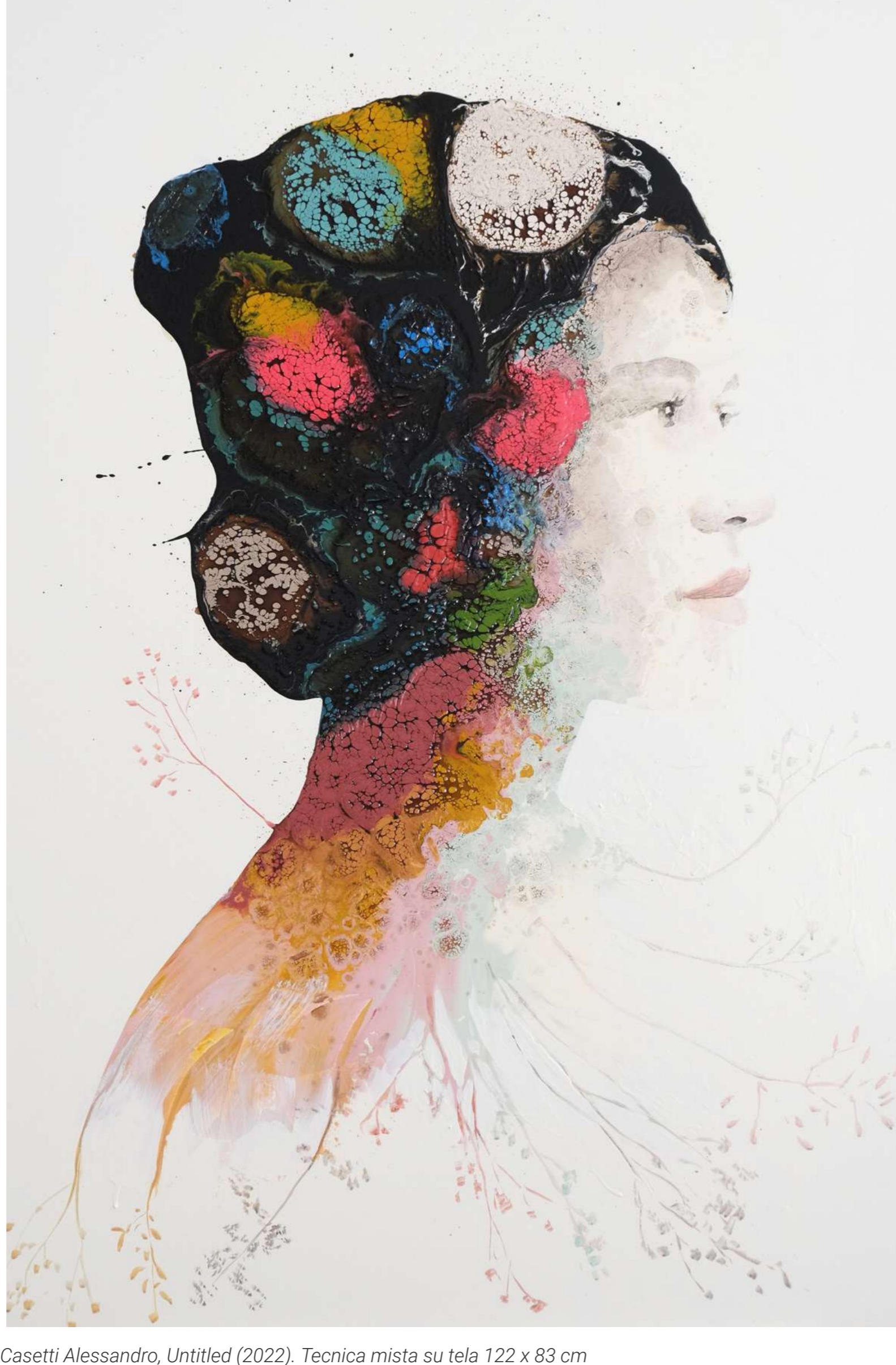
Casetti Alessandro, Untitled (2022). Tecnica mista su tela 122 x 83 cm

Tra le esperienze portate a Dumbo spiccano la performance estrema e radicale di Giulio Boccardi , che per quattro giorni resterà sospeso su una colonna, come un monaco stilita, circondato da schermi che mostrano catastrofi ambientali, trasmettendo le opere video di Leonardo Panizza . Il pubblico potrà interagire inviandogli acqua e cibo vegano tramite una carrucola. Una prova di resistenza ed empatia, un'elevazione spirituale che unisce videoarte e performance e che sarà trasmessa in streaming per tutta la sua durata.