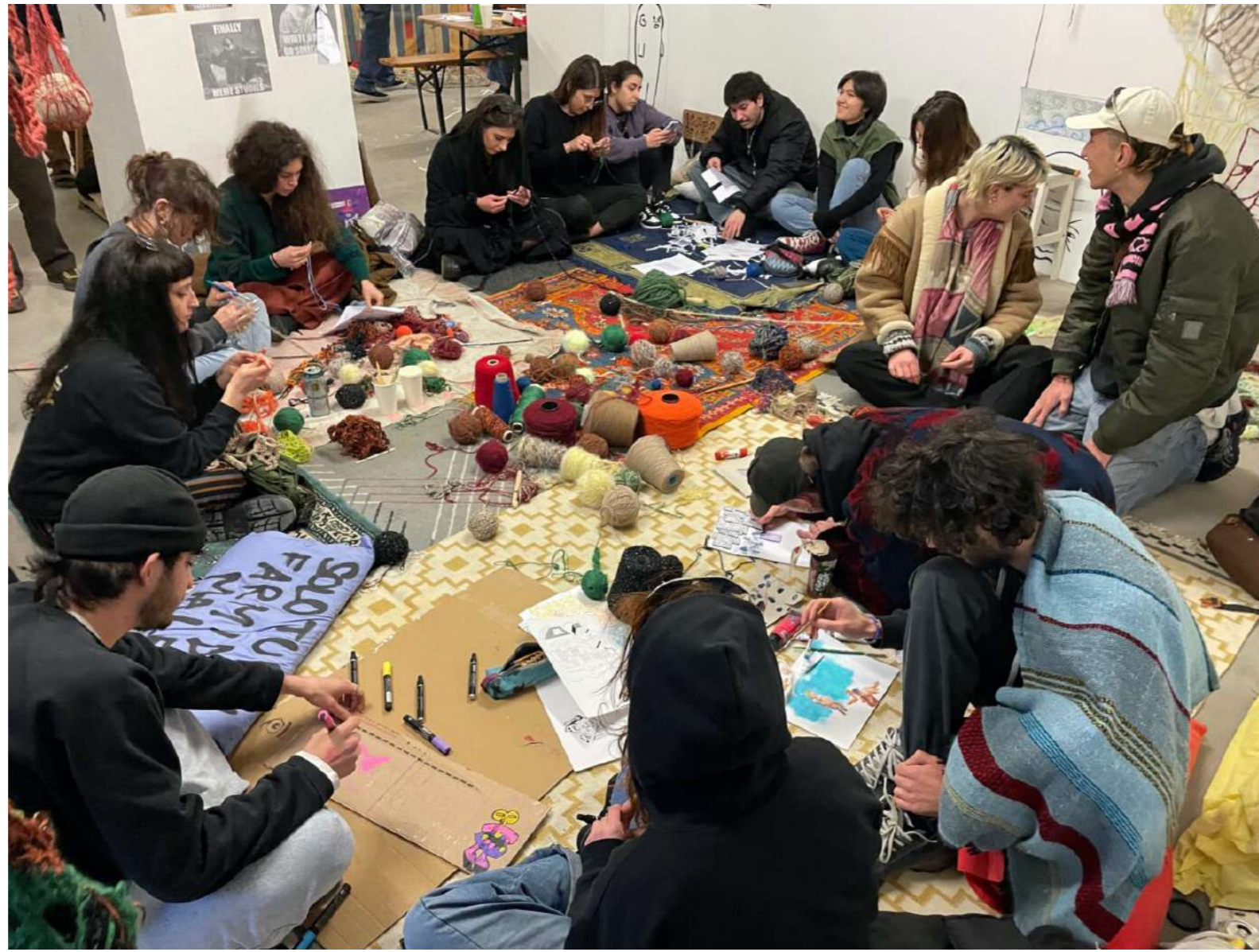
Collettivo KAIROS, Uncinetti KAIROS (2023). Macramé all'uncinetto, 250 x 300 cm

La fiera bolognese dell'arte "emergente e in stato di emergenza" torna dal 1 al 4 febbraio nei giorni di ART CITY e del cinquantenario di Arte Fiera, negli spazi rigenerati di Dumbo , l'ex scalo ferroviario Ravone. La quarta edizione di BOOMING Contemporary Art Show ci riporta a noi, che agiamo nel mondo e lo facciamo in questo momento: il tema è "ADESSO" : la manifestazione riporta l'attenzione sul qui e ora, ciò che non è rimandabile. Perché l'arte di cui abbiamo bisogno ci pone davanti a delle scelte, e non teme nulla se non l'apatia verso il futuro.